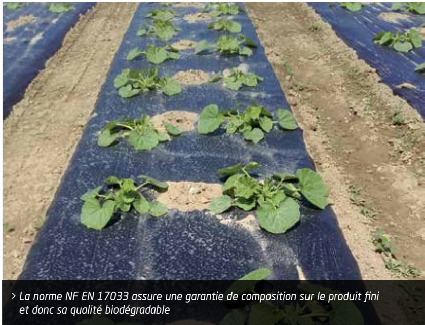
> La norme NF EN 17033 assure une garantie de composition sur le produit fini et donc sa qualité biodégradable

F ace aux contraintes de recyclage et au coût de collecte croissant, la recherche sur le biodégradables progresse. L'objectif consiste à produire et à proposer des films plastiques qui répondent aux attentes techniques et environnementales de l'agriculteur. Technique car l'élasticité du produit impacte sa capacité à couvrir le sol et donc à prévenir l'enherbement. Il facilite le travail de l'agriculteur qui n'a plus à gérer la gestion des déchets (collecte, broyage, enfouissement...). En parallèle, les résidus de film ne doivent pas souiller le produit une fois récolté sous peine de le déclasser. L'attente environnementale pousse quant à elle à produire un plastique qui se dégrade dans le sol et ne crée aucune toxicité. Ce caractère biodégradable est réglementé par les normes NF EN 17033 (obligatoire en culture biologique) et NF U 52 001.