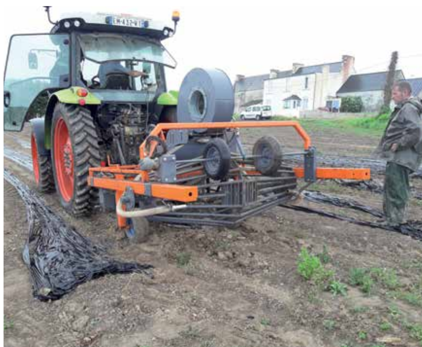
> Les films plastiques apportent un bénéfice sanitaire aux légumes

Il est alors de la responsabilité des producteurs de les éliminer (article L 541-2 du code de l'Environnement). Le recyclage des FAU est un critère de plus en plus récurrent au sein des labels de qualité comme c'est le cas pour le label Global G.A.P. La filière légumière a alors installé, en collaboration avec les collecteurs, des points de récolte avec l'objectif de couvrir largement le territoire : les producteurs les trouvent à moins de 10 km de leur exploitation afin de déposer leurs FAU et limiter les coûts et l'empreinte carbone. Sur place, l'organisme Adivalor est ensuite chargé de récupérer ces films plastiques afin de les traiter.